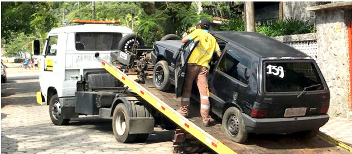
Carros serão transportados para um terreno alternativo, localizado na Avenida Gentil Perez, 3.000, Umuarama

A Prefeitura de Itanhaém, por meio da Secretaria de Trânsito e Segurança Municipal, começou nesta segunda-feira (7) a remoção de carros abandonados pelas ruas da Cidade. Os veículos são transportados para um terreno alugado, localizado na Avenida Gentil Perez, 3.000, Umuarama. Estudos apontam que há cerca de 100 veículos nessas condições. O local conta com segurança dos Guardas Patrimoniais e tem capacidade para 400 veículos.