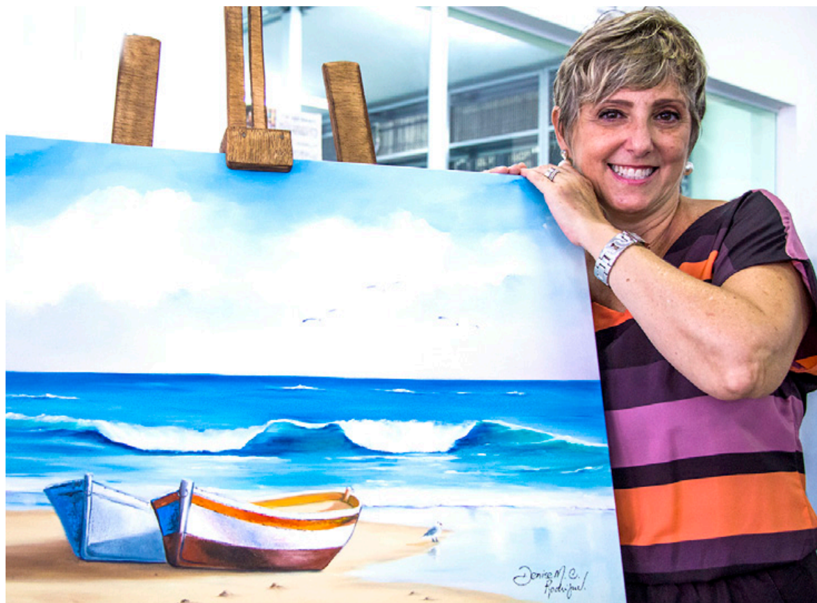
As artes estão expostas até o dia 30 deste mês, das 12 às 19 horas, na Avenida Rui Barbosa, 867, Centro

O exame acontecerá no dia 24 de junho. Serão 80 vagas à disposição, sendo metade para cada curso. As aulas acontecerão em período noturno, das 19 às 23 horas, com duração de três semestres.