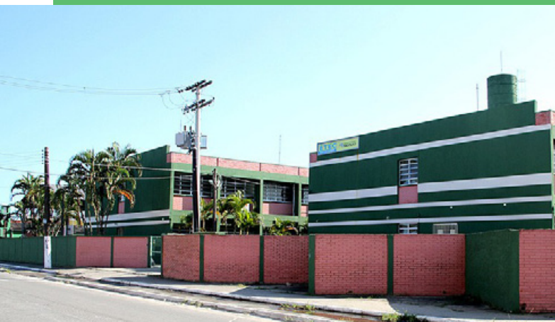
ETEC de Itanhaém fica na Avenida José Batista Campos, 1.431, Anchieta

CURSOS TÉCNICOS ■ Interessados têm até o dia 25 de maio, às 15 horas, e podem se inscrever pela internet