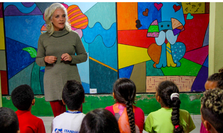
Palestra teve o tema "Lixo, que lixo é esse?"