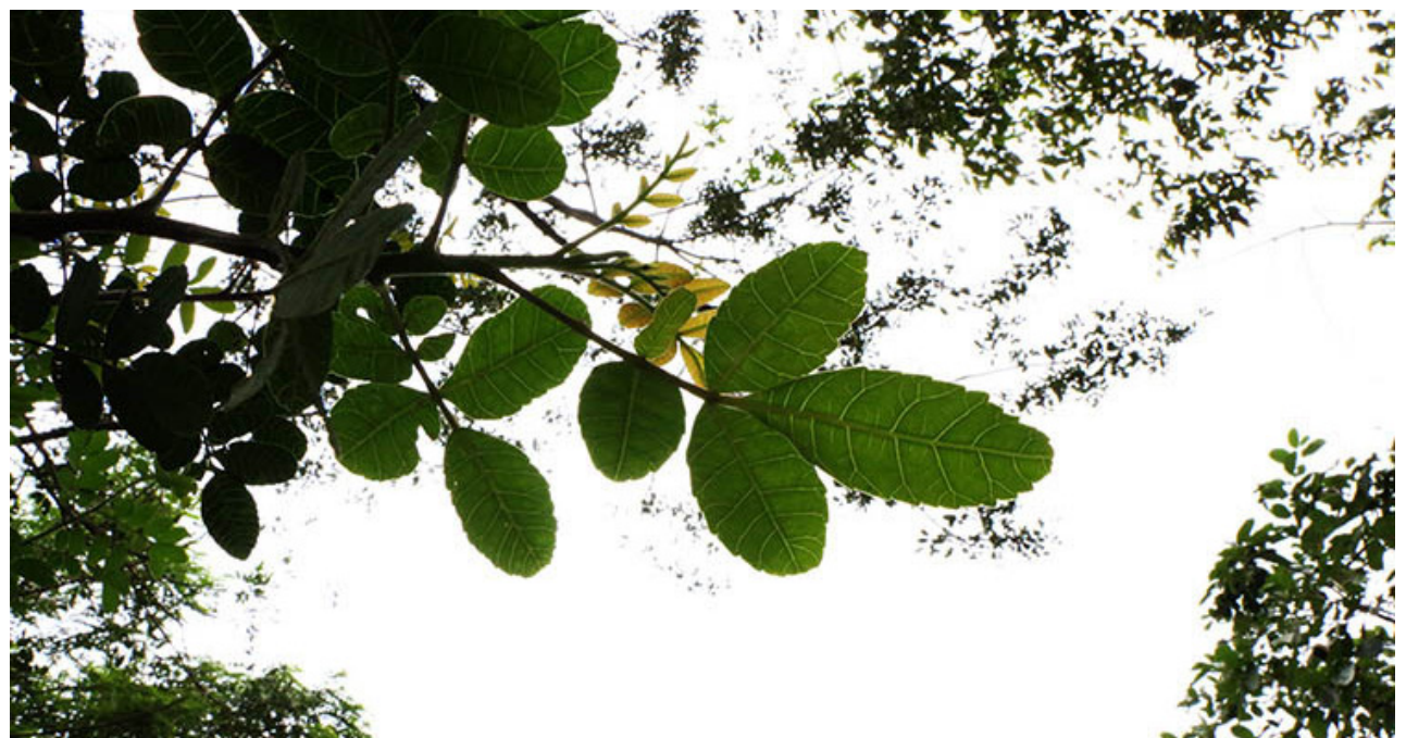
Secretaria de Planejamento e Meio Ambiente, Circulando a Educação Ambiental no Estado de São Paulo

A Síntese do Encontro da Rede de Educação Ambiental da Baixada Santista (REABS) entrará em pauta a partir das 10h30. Em seguida os participantes terão o "Almoço com prosa" às 11 horas. Após o almoço a programação segue com a orienta-