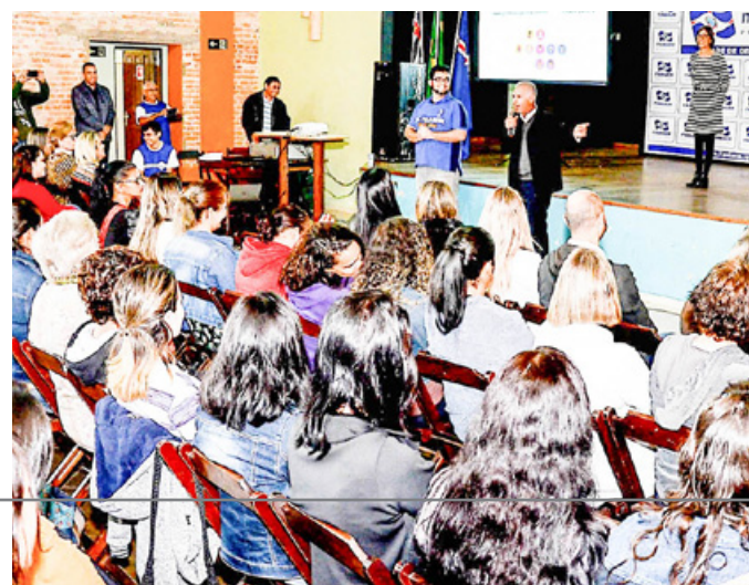
O encontro reuniu cerca de 300 funcionários da educação