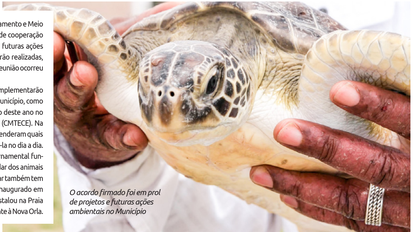
O acordo firmado foi em prol de projetos e futuras ações ambientais no Município

O Instituto Greemar é uma organização não governamental fundada em 2004, no Guarujá, e promove ações para cuidar dos animais marinhos e da costa. Além da sede no Guarujá, o Greemar também tem uma base de monitoramento no canal de Bertioiga, inaugurado em 2013. Em 2016, uma nova Base de Reabilitação se instalou na Praia dos Pescadores, em Itanhaém, hoje transferida em frente à Nova Orla.