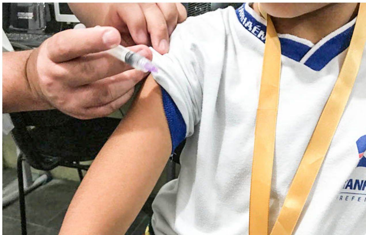
Crianças de 1 a 4 anos e 11 meses devem tomar a vacina, conforme orientação do Ministério da Saúde