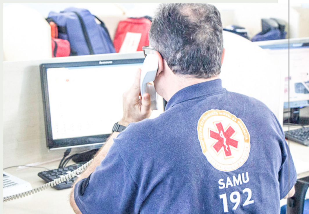
Tão ágil quanto as ambulâncias é o atendimento telefônico

“As situações relatadas nos trotes, em sua maioria, apresentam risco eminente de morte, o que prejudica o atendimento do serviço emergencial que acolhe toda população. Em casos de ocorrências graves, é deslocada uma unidade de suporte avançado tripulada por um médico intervencionista, um enfermeiro e um condutor socorrista. Quando acontece um falso chamado, uma unidade como esta pode deixar