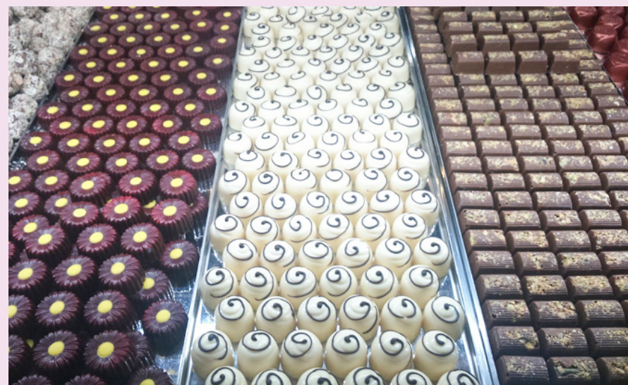
Alunos aprenderão a fazer salgados finos e doces especiais para festas, tortas finas e bolo gourmet.

Os seleccionados no Programa Escola da Família devem atuar aos fins de semana (sábado ou domingo) em uma unidade escolar conveniada em ações para crianças, adolescentes, adultos e idosos e também auxiliar o trabalho dos voluntários nas oficinas. Todos são supervisionados pelos professores e coordenadores das unidades.