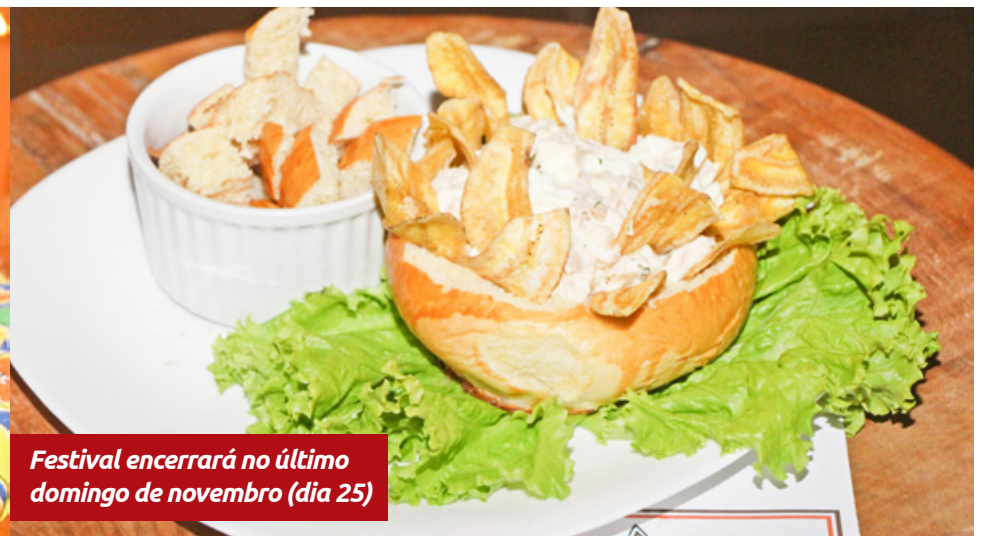
Festival encerrará no último domingo de novembro (dia 25)

A edição de 2018 do Festival Gastronômico Sabores Caiçara se estende até domingo (25). Este ano, 15 restaurantes são participantes. Para os interessados em experimentar alguns dos pratos, os preços variam entre R$29,90 e R$49,90. As iguarias são feitas com ingredientes da região, como peixes, banana, mandioca e frutos do mar.