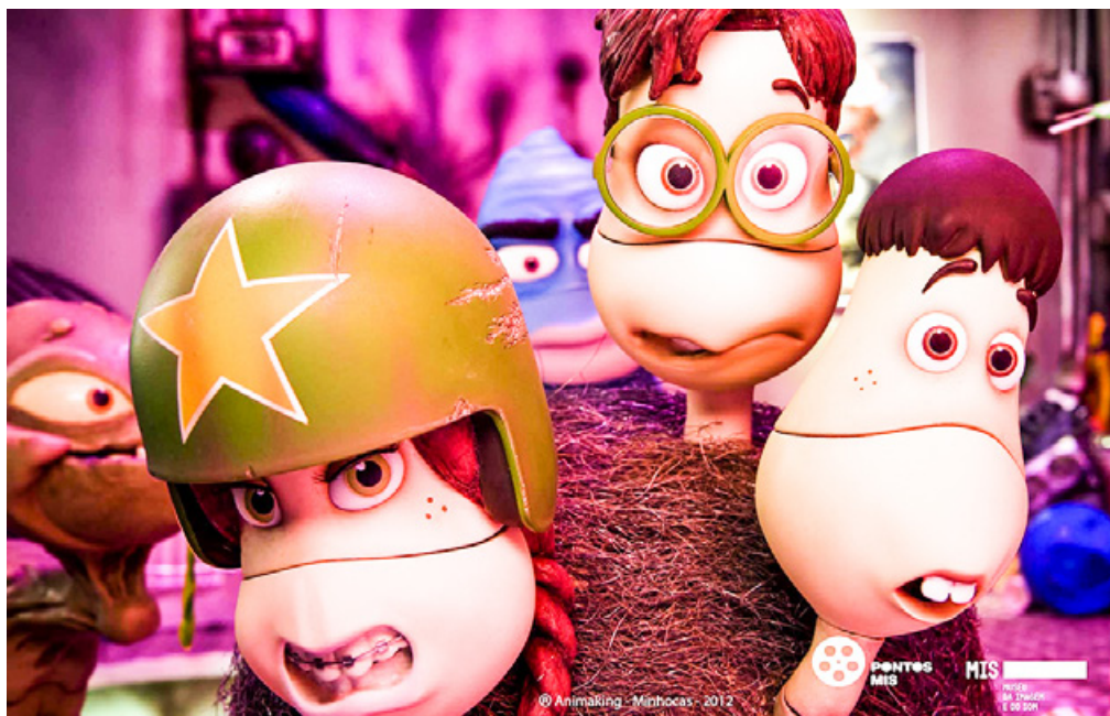
“Minhocas, o filme” estará disponível nesta terça-feira (27), com sessões às 9 e às 14 horas

“Minhocas, o filme” conta a história de Júnior, uma minhoca de 11 anos que não consegue fazer amigos e se adaptar ao meio em que vive, até ser escavado para fora da terra, quando inicia uma aventura de volta à sua casa. O longa brasileiro “Hoje Eu Quero Voltar Sozinho” retrata a luta de Leonardo, um personagem cego que quer conquistar a independência e tenta lidar com uma mãe superprotetora.