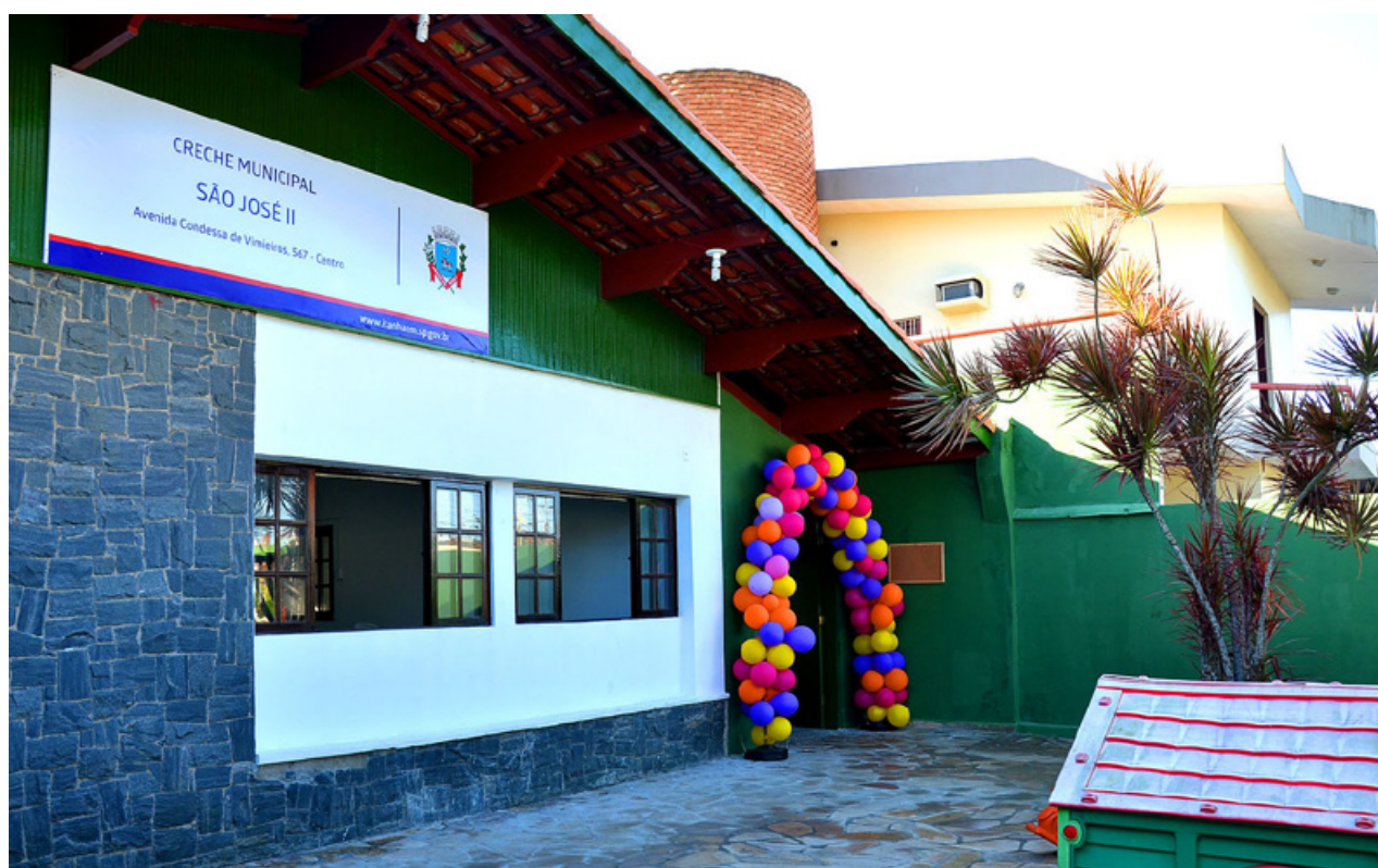
A partir do ano que vem a unidade terá capacidade para 120 crianças