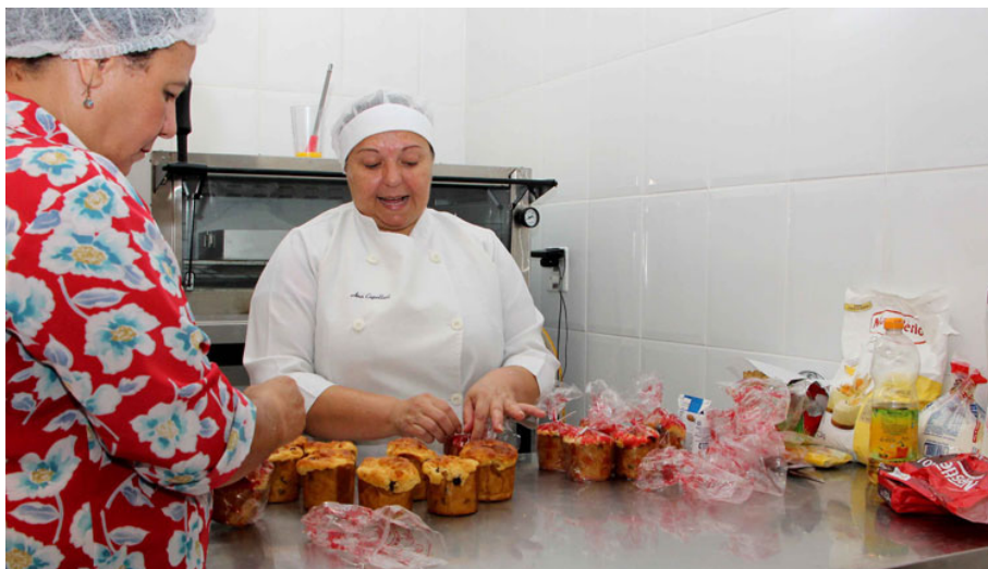
As 50 vagas ofertadas serão para duas turmas com 25 alunos

As 50 vagas ofertadas serão para duas turmas com 25 alunos. A primeira turma terá aula às segundas e quartas-feiras, das 8h30 às 11h30, a partir do dia 2 de setembro. Enquanto isso, a segunda turma terá curso no mesmo horário, só que às terças e quintas-feiras. O início para este grupo está previsto para o dia 3 de setembro.