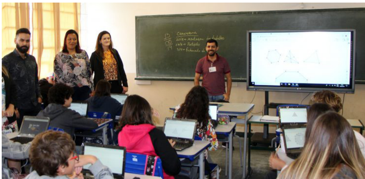
O prefeito e técnicos da Prefeitura de Santa Bárbara, de Minas Gerais, visitaram as escolas Lilian Aparecida e Bernadino de Souza

EXEMPLO As práticas bem sucedidas na educação tornaram a Cidade referência nacional