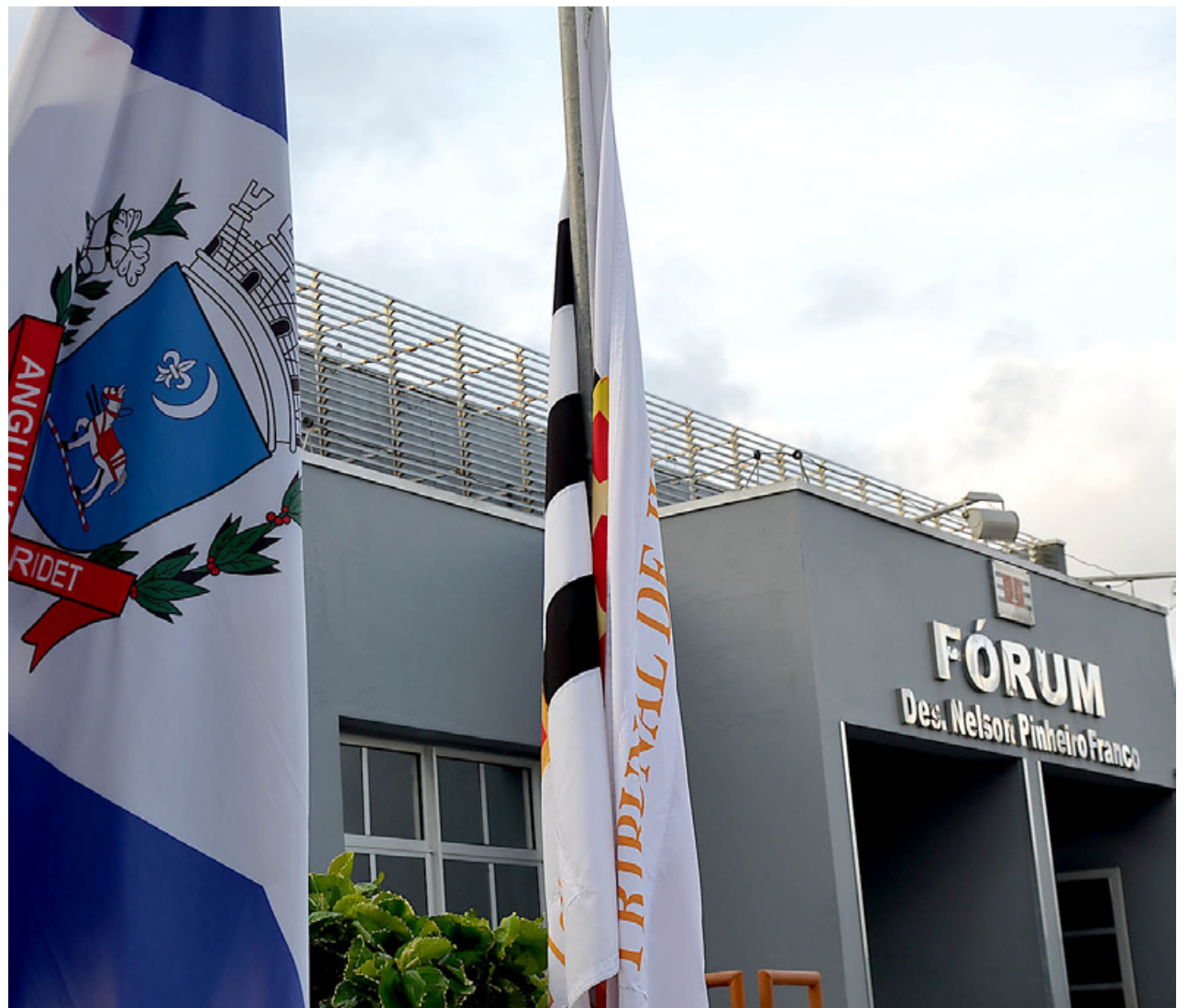
O serviço funcionará na sede do Fórum de Itanhaém, na Avenida Rui Barbosa, 867, no Centro