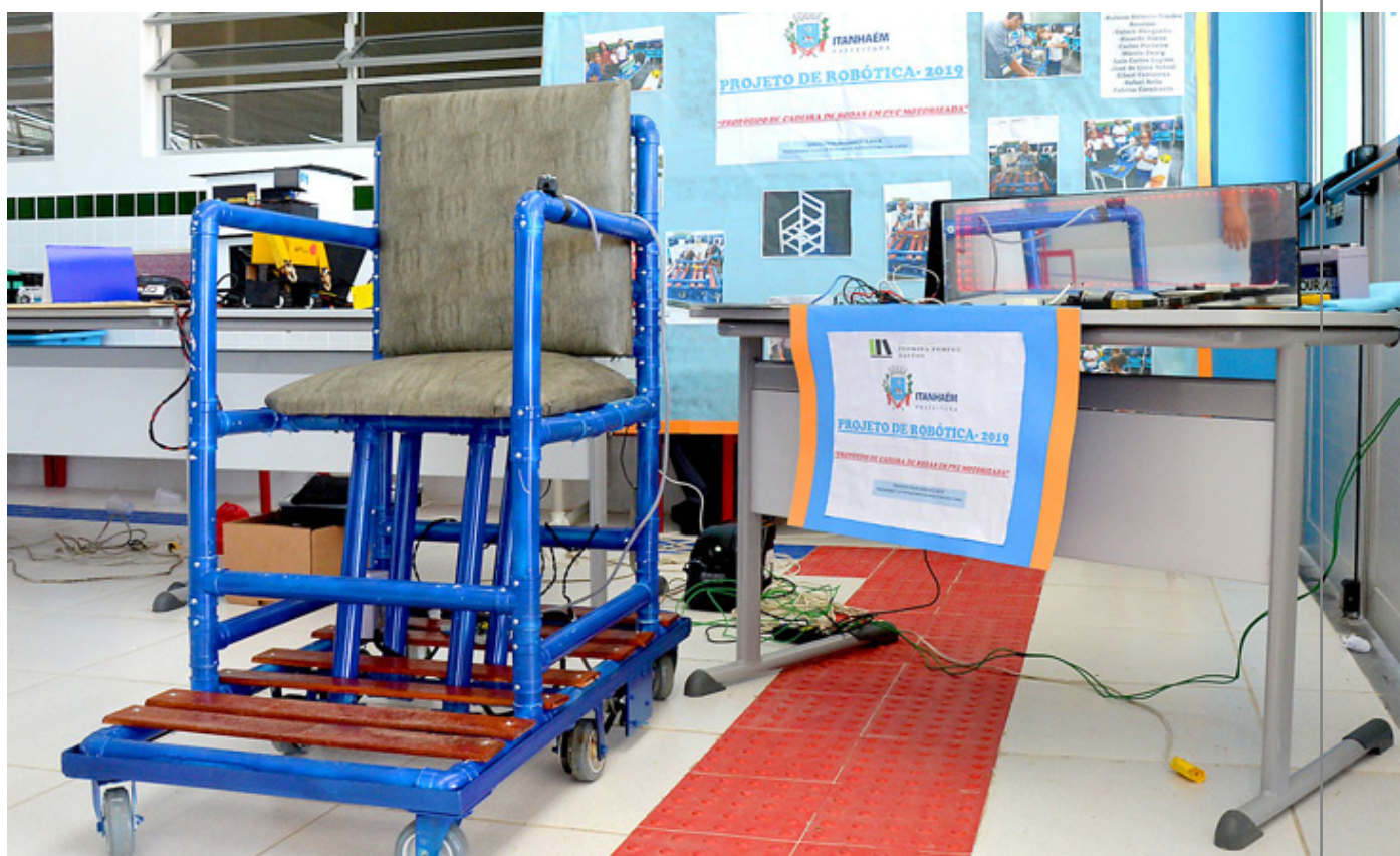
Um dos projetos foi a cadeira de roda elétrica, comandada por controle remoto ou aplicativo de celular