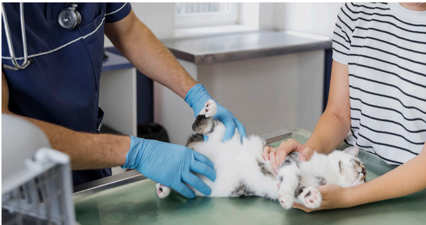
Caso seja aprovado, o tutor receberá informações sobre o local, data e horário em que ocorrerá a cirurgia

Departamento de Vigilância em Saúde Telefone: (13) 3426-6706 Rua Benedito Celestino, 17, Vila São Paulo Atendimento: de segunda a sexta-feira, das 8 às 12 horas e das 13 às 16 horas.