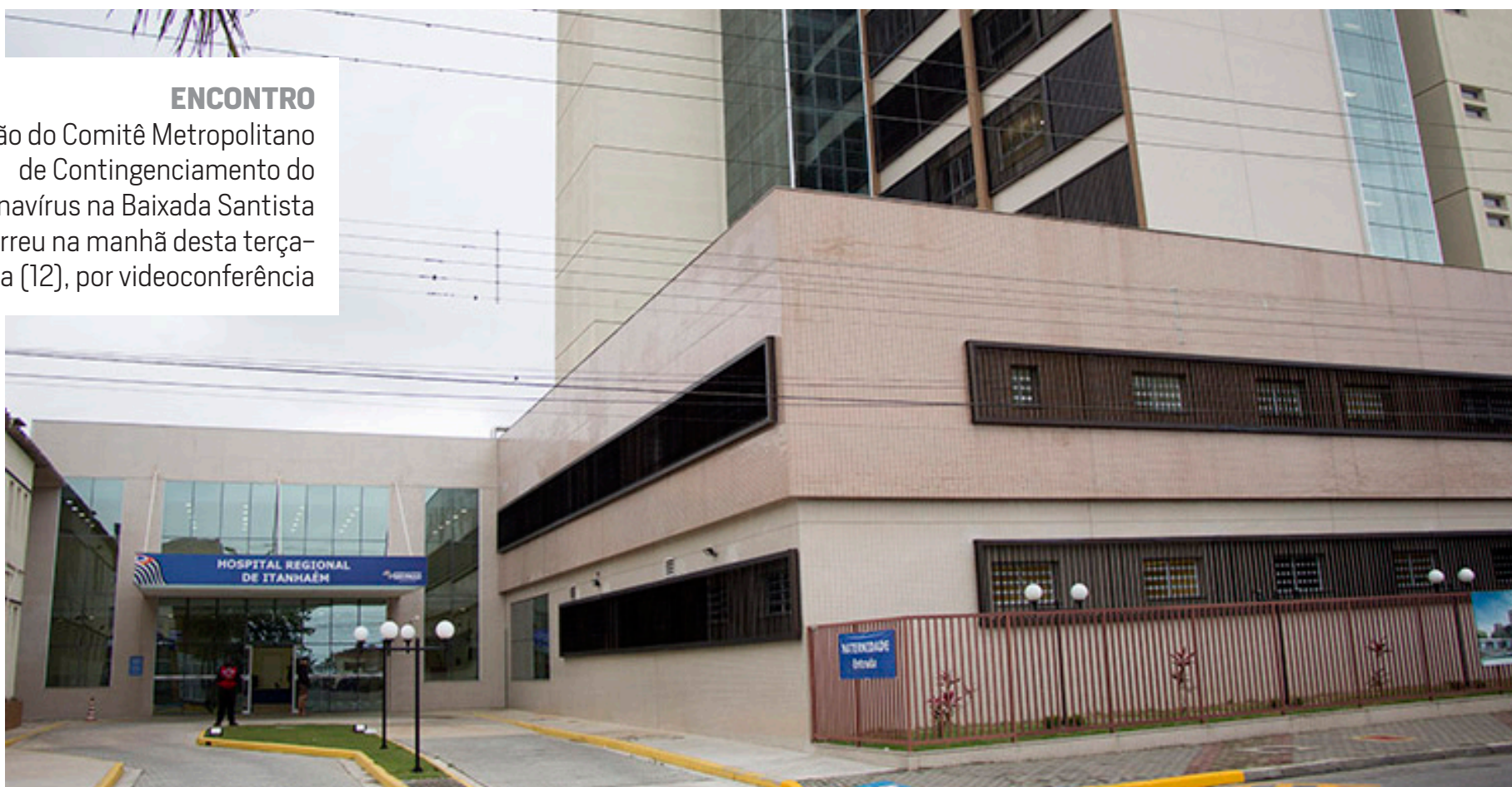
Cidades da Baixada Santista irão formalizar ao Governo do Estado pedido para que seja ampliado o atendimento no Hospital Regional Jorge Rossmann de Itanhaém

Reunião do Comitê Metropolitano de Contingenciamento do Coronavírus na Baixada Santista ocorreu na manhã desta terça-feira (12), por videoconferência