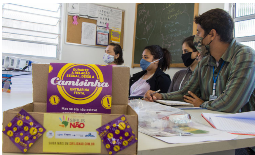
A USF do Grandesp foi a primeira a obter o curso, executado no último dia 22