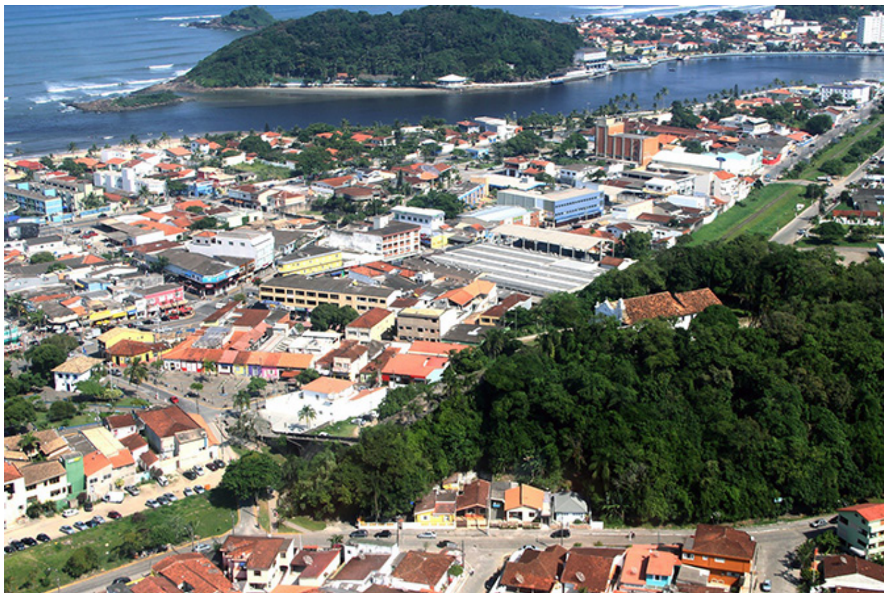
A mudança obriga comércios e serviços a funcionarem no máximo a 10 horas por dia

CORONAVÍRUS A medida, que entrou em vigor na quarta-feira (2), é mais restritiva que a verde, e limita mais os horários de funcionamento do comércio e serviços