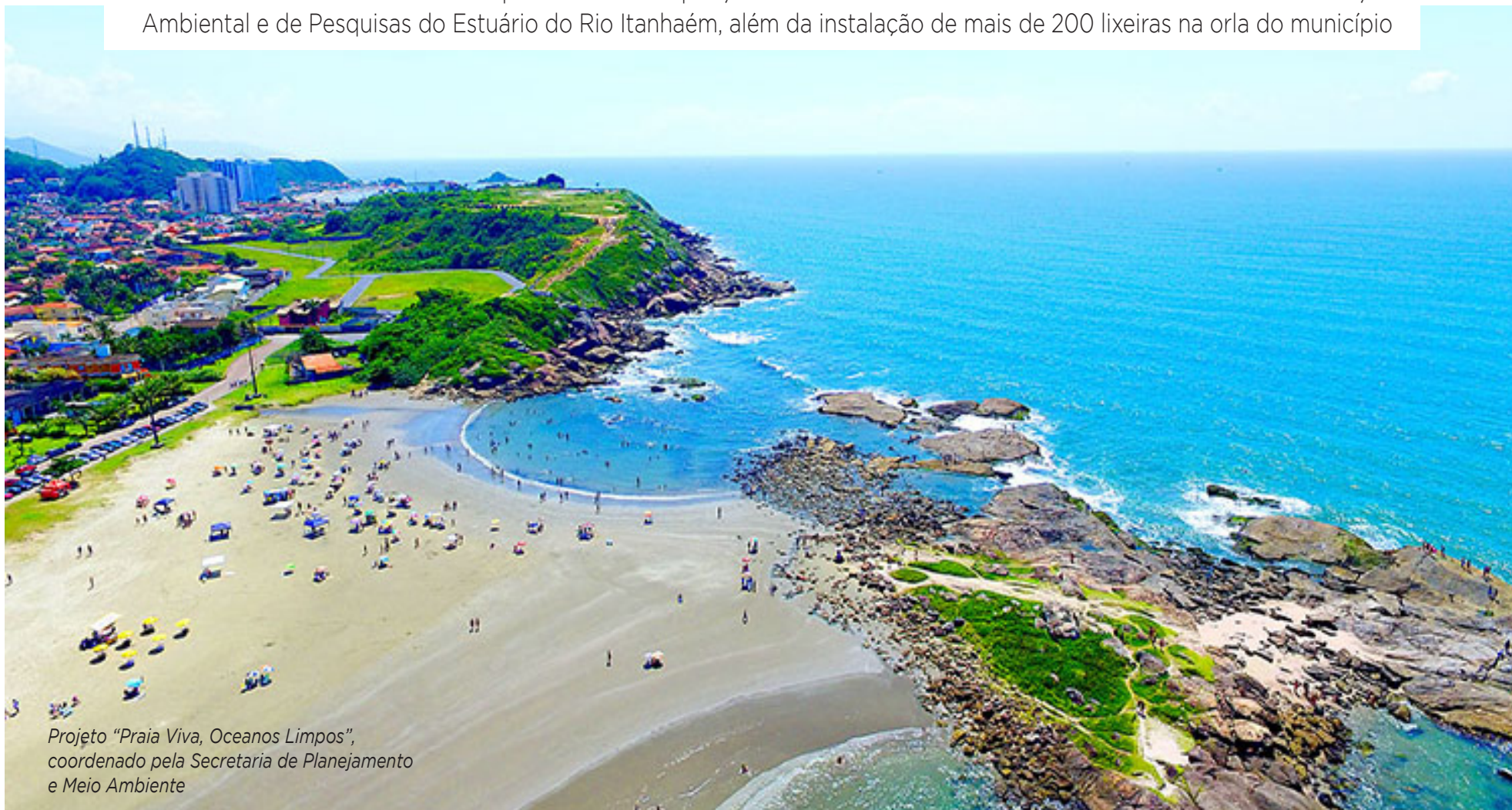
Projeto "Praia Viva, Oceanos Limpos", coordenado pela Secretaria de Planejamento e Meio Ambiente

MEIO AMBIENTE • Recurso possibilitará a aquisição de veículo e reforma de uma ala do Centro de Educação Ambiental e de Pesquisas do Estuário do Rio Itanhaém, além da instalação de mais de 200 lixeiras na orla do município