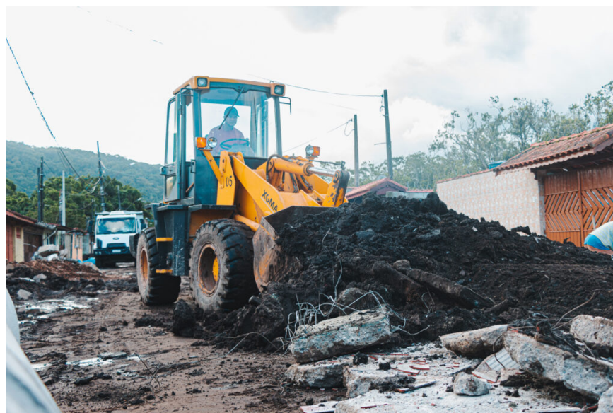
A pavimentação do Loty e Verde Mar faz parte de um conjunto de três pacotes de obras, todos frutos de convênios celebrados pela Prefeitura de Itanhaém com a Secretaria de Governo e Relações Institucionais do Estado de São Paulo.