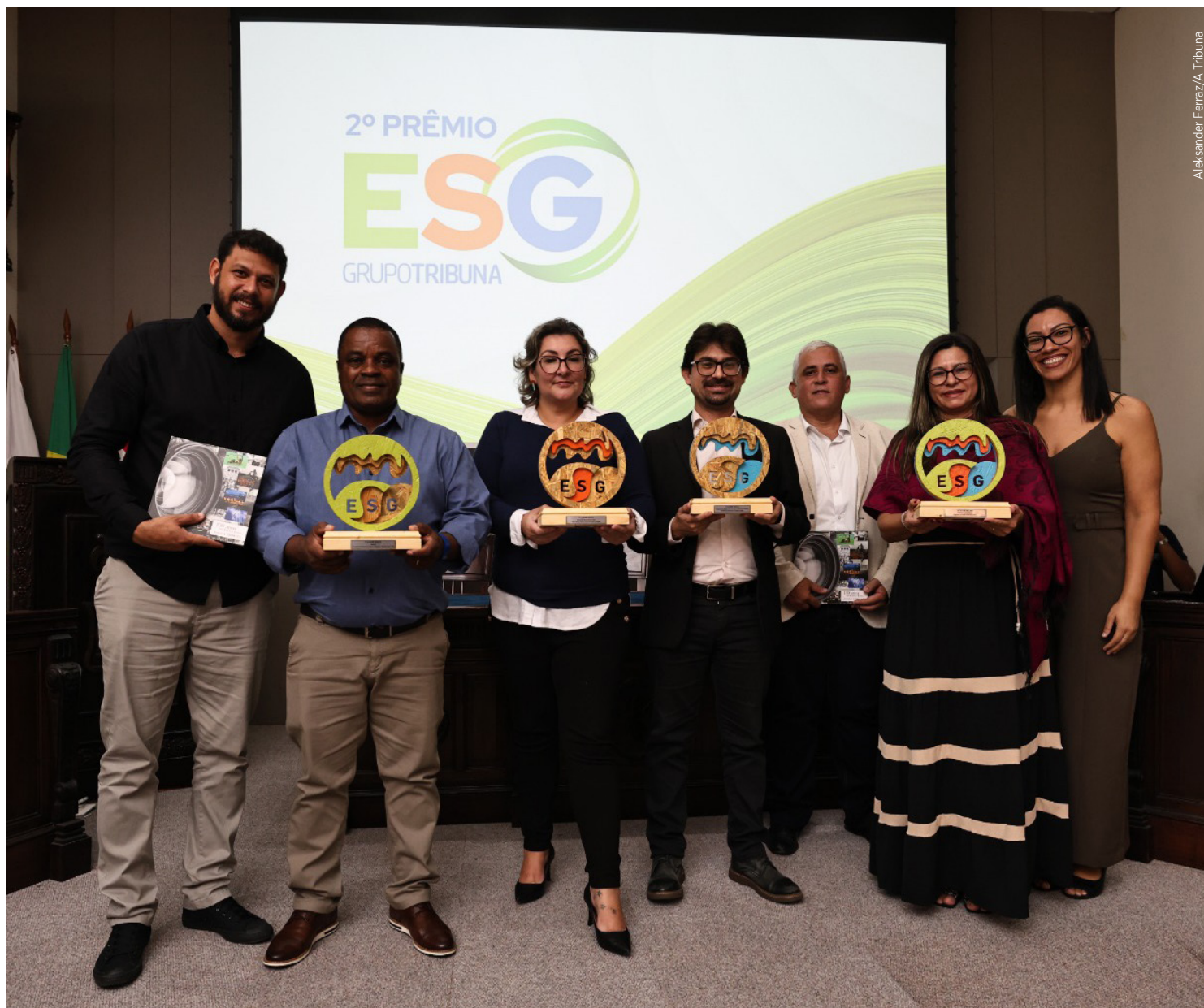
Aleksander Ferraz/A Tribuna

O Troféu ESG Grupo Tribuna está em sua segunda edição e é uma iniciativa institucional que tem como objetivo reconhecer e premiar empresas públicas e privadas que desenvolvem projetos ou iniciativas com o foco de ampliar a consciência sobre sustentabilidade ambiental, social e governança.