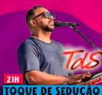
TOQUE DE SEDUÇÃO