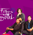
FILHOS DO SOUL