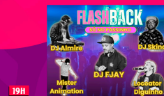
FLASHBACK "SO NO PASSINHO"