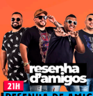
RESENHA DE AMIGOS